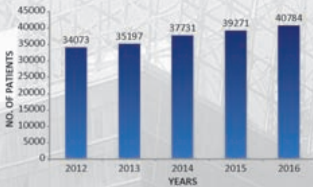
CASE FILE REGISTRATIONS